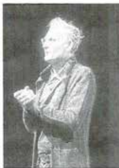
Jean-Claude Gallotta est allé à la rencontre du public de l'Oriel à l'issue du spectacle, signant de nombreux autographes.

À la fin du spectacle, comme après chaque représentation, les danseurs se sont mêlés aux spectateurs dans le hall de l'Oriel. C'est l'avantage d'une petite salle qui nous permet à chaque fois d'échanger nos impressions, notre enthousiasme et d'être au plus près des artistes. La configuration de la salle de spectacle elle-même permet de se laisser prendre au jeu facilement.