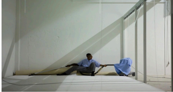
Dana Michel propose toujours une danse aux limites du performatif, un engagement physique proche de la sidération.

Lundi 3 et mardi 4 juillet 2023, 14h, Salle Bédart / Agora