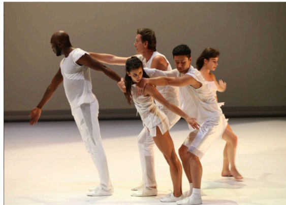
Pour Montpellier Danse, Gallotta a créé une adaptation spéciale pour le plein air, d'où le titre, Ulysse, Grand large, version inédite où ne manqueront ni les brises marines ni les cris des oiseaux.

Lundi 3 Juillet 2023, 22h Théâtre de l'Agora